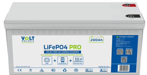
LiFePO4 battery 25,6V 200Ah (200A)