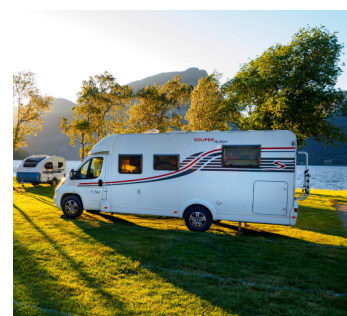
Zastosowanie w kamperach