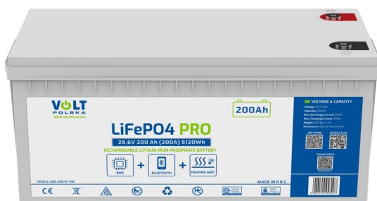
Akumulator LifePO4 25,6V 200Ah (200A)