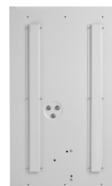
SinusPRO S 3000 48V