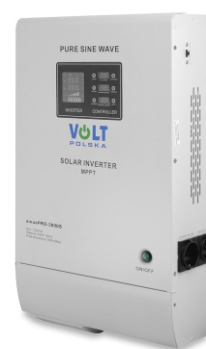
SinusPRO S 3000 48V